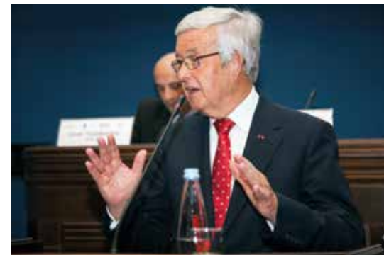
აიმერტ ვან მიდელვოკოპი

ამ და სხვა თემებზე მსჯელობდნენ თბილისში ახალგაზრდა პოლიტიკოსები საქართველოდან, აზერბაიჯანიდან, სომხეთიდან, უკრაინიდან და ნიდერლანდებიდან.